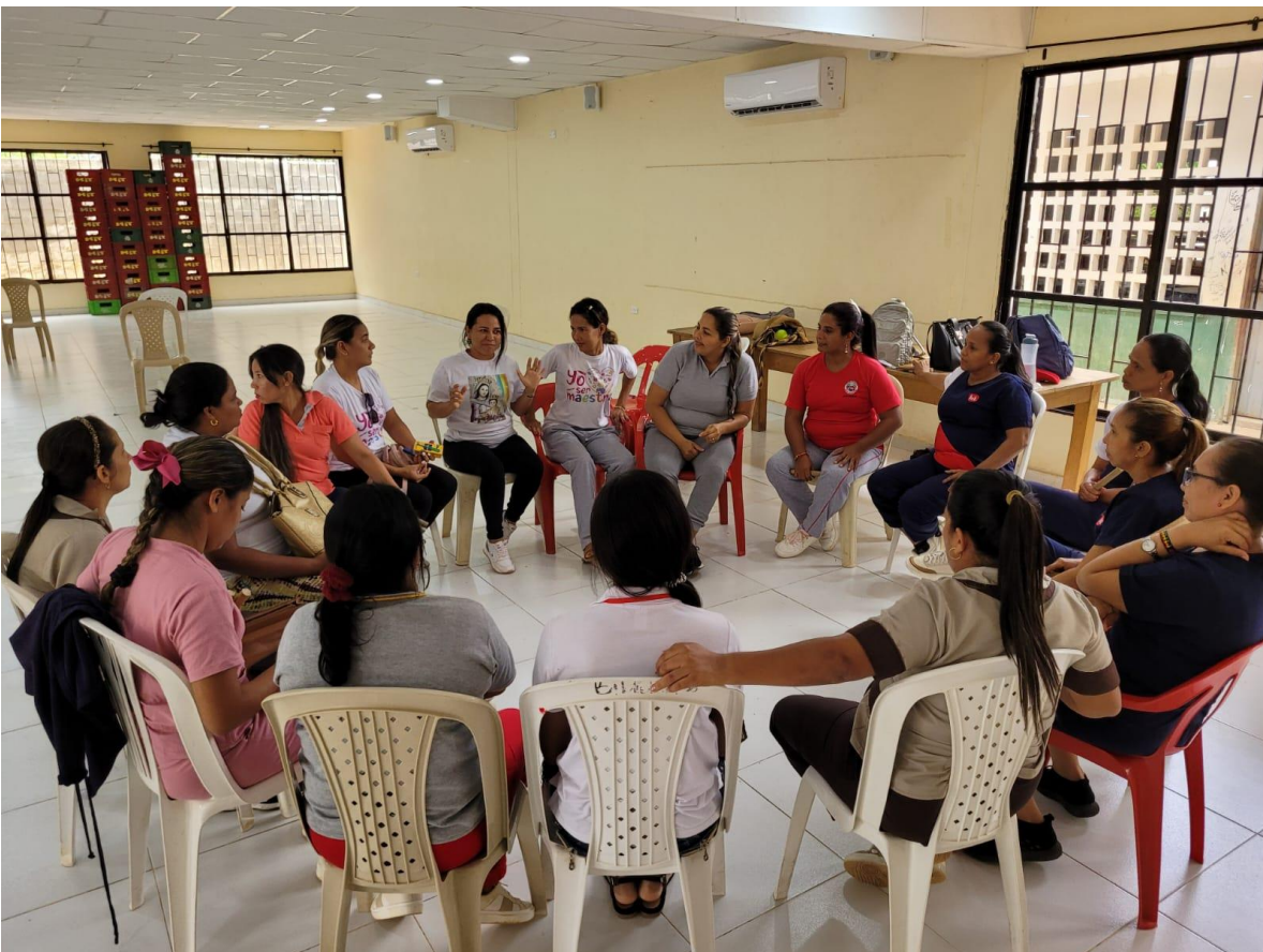
Charla a docentes sobre educación inicial